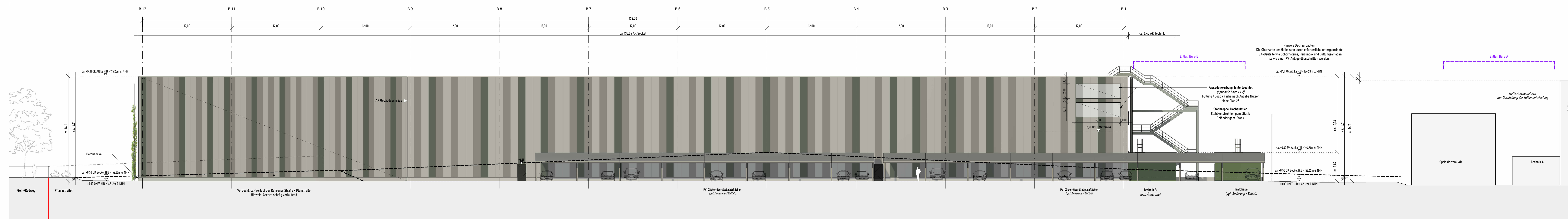
Ansicht Ost Halle B M:200