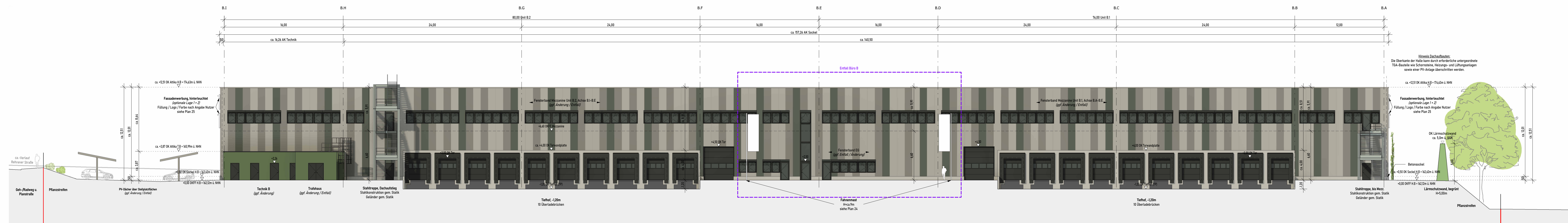
Ansicht Nord Halle B MI:200