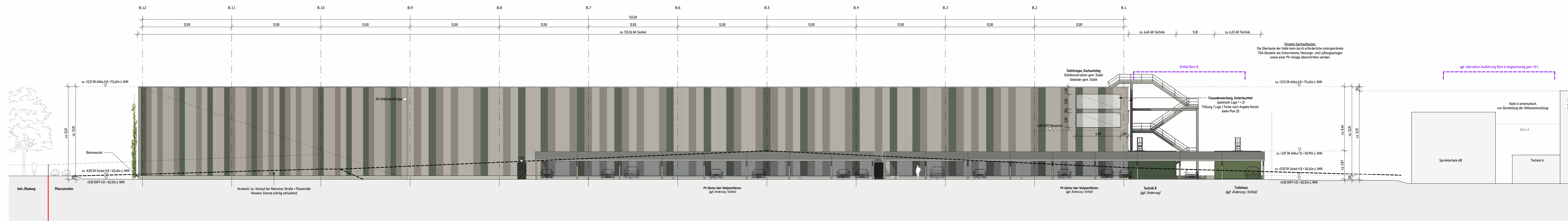
Ansicht Ost Halle B MI:200